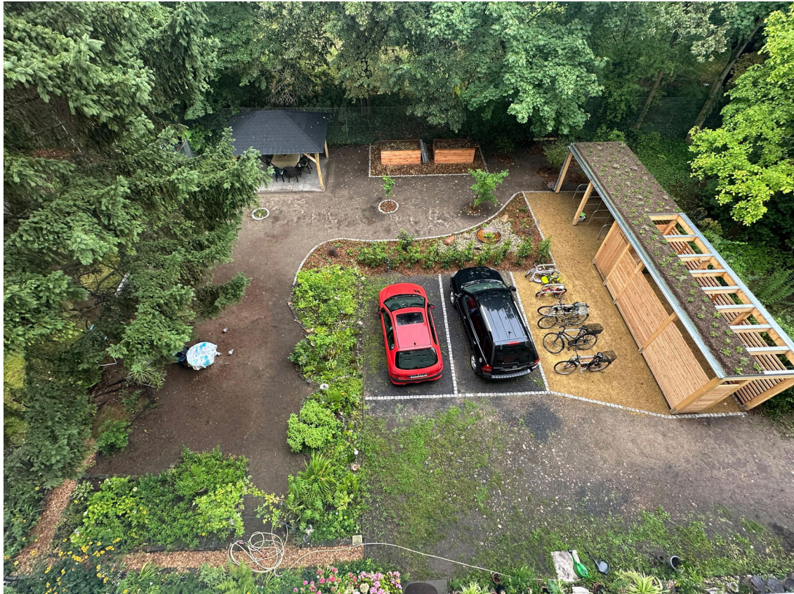
Der umgestaltete Hof in der Lübecker Straße 4

In Zusammenarbeit mit der Gewobag wurden zudem die Höfe der Lübecker Straße 8, 9-10 klimaresilient umgestaltet und bieten nun eine spürbar erhöhte Aufenthaltsqualität.