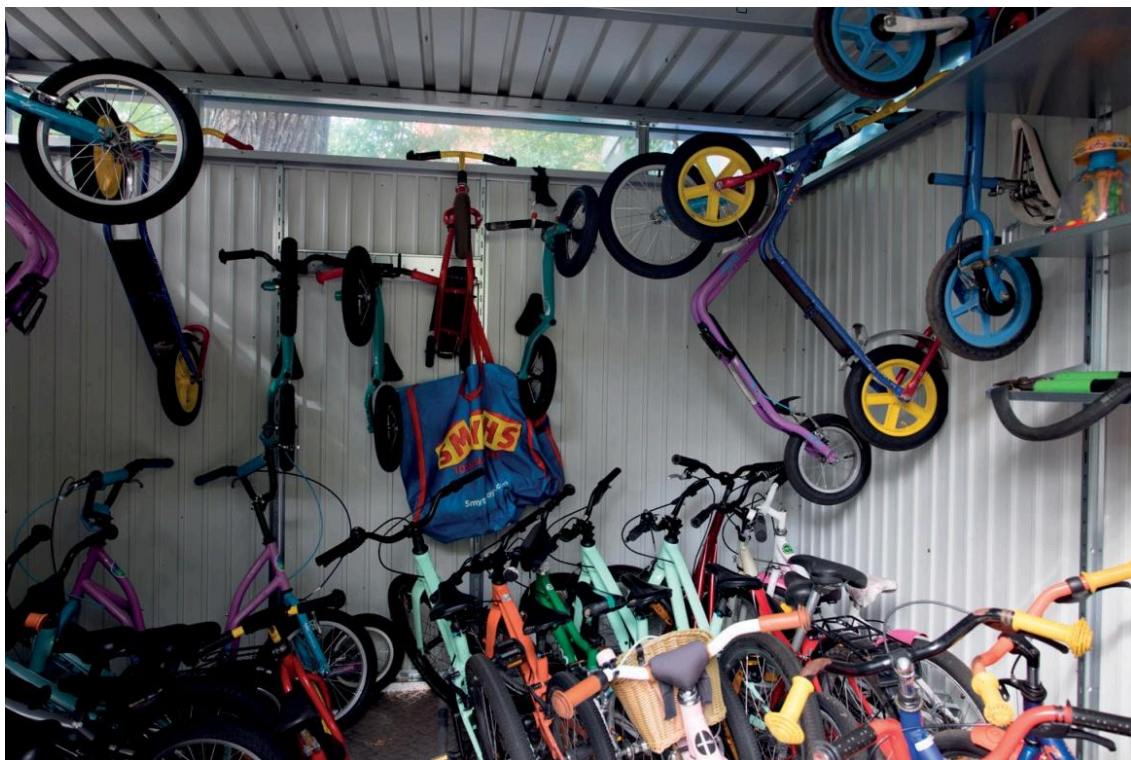
Radgarage in der Jugendverkehrsschule Bremer Straße © ff-Architekten

Auch am Standort der Jugendverkehrsschule Bremer Straße wird fleißig geplant. Seit Mitte 2025 arbeitet das Büro ff-Architekten gemeinsam mit der S.T.E.R.N. GmbH an einer Machbarkeitsstudie für die Jugendverkehrsschule. Neben der Sanierung und Erweiterung werden in verschiedenen Varianten auch der Neubau des Bestandsgebäudes, die Neugestaltung der Außenanlagen sowie die Unterbringung der Mittelpunktbibliothek an diesem Standort geprüft. Auch hier soll in den kommenden Wochen Planung abgeschlossen sein.