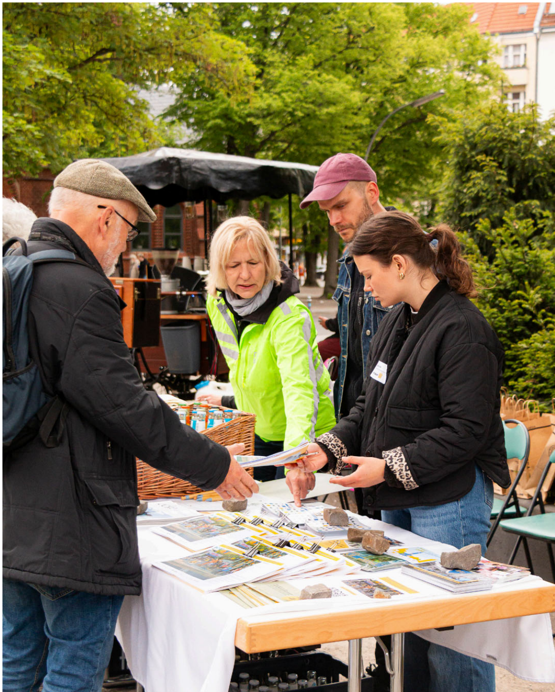
Kiezrallye am Tag der Städtebauförderung am 10. Mai 2025