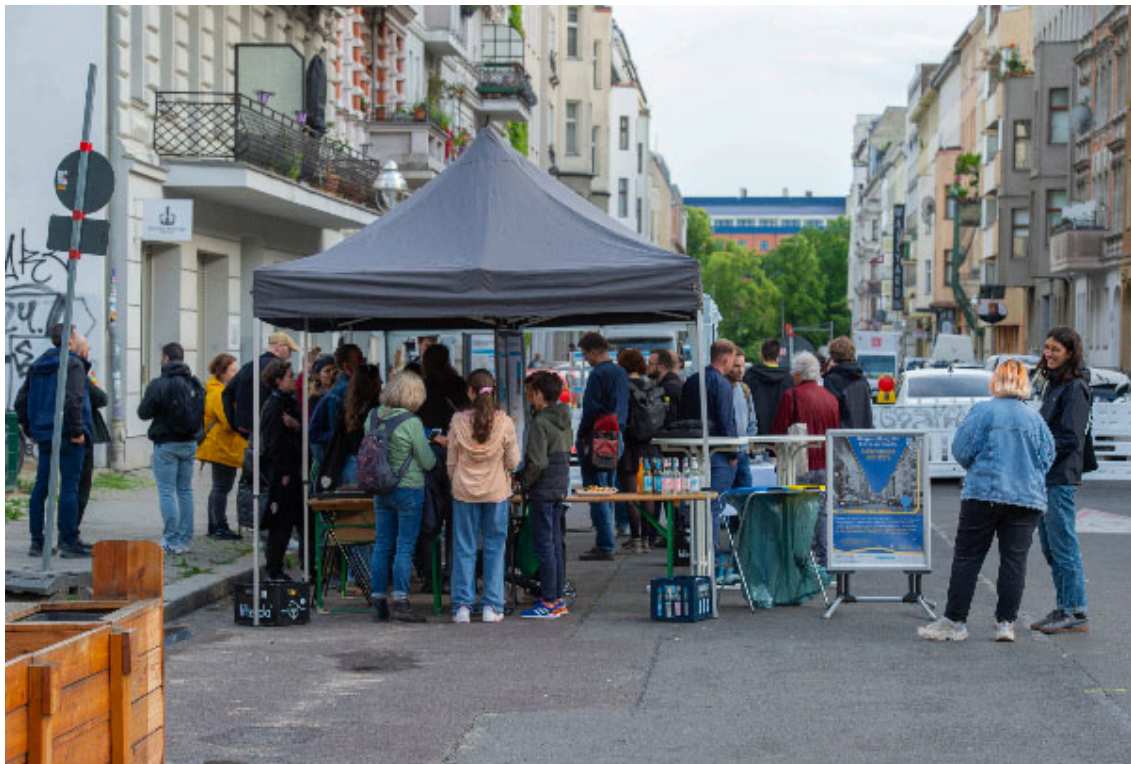
Beteiligungsveranstaltung Lübecker Straße am 28.05.2025

Mittlerweile wurden aus den Planungsvarianten und dem Feedback der Beteiligungsveranstaltung zwei Vorzugsvarianten entwickelt, die aktuell mit allen Planungsbeteiligten abgestimmt werden.