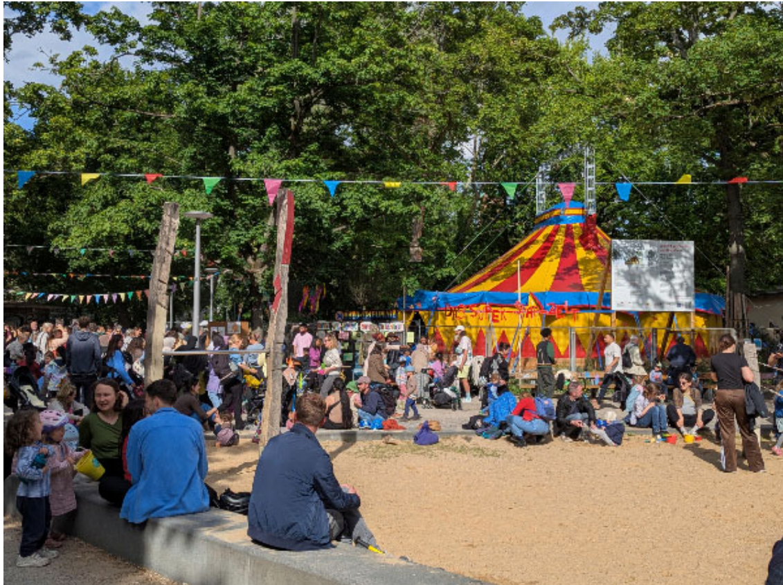
Richtfest Moabiter Kulturmanege am 27.05.2025

Eine große Veränderung ist außerdem am Otto-Spielplatz zu entdecken. Ende Mai erfolgte die Aufstellung des Zeltes für die Moabiter Kulturmanege , was mit einem Richtfest am 27. Mai gefeiert wurde. Ein neuer Zugang zum Ottopark ermöglicht eine Nutzung auch außerhalb des Spielplatzbetriebs und schafft Sichtbarkeit. Zur Beheizung in den kälteren Monaten werden aktuell Luft-Luft-Wärmepumpen zusammen mit einer Photovoltaik-Anlage auf dem Spielhausdach installiert. Auch der Innenausbau ist mit dem Einbau der Tribüne und der Veranstaltungstechnik weit vorangeschritten. Wir freuen uns im Frühjahr 2026 die große Einweihung gemeinsam mit euch und dem Moabiter Ratschlag e.V. feiern zu können.