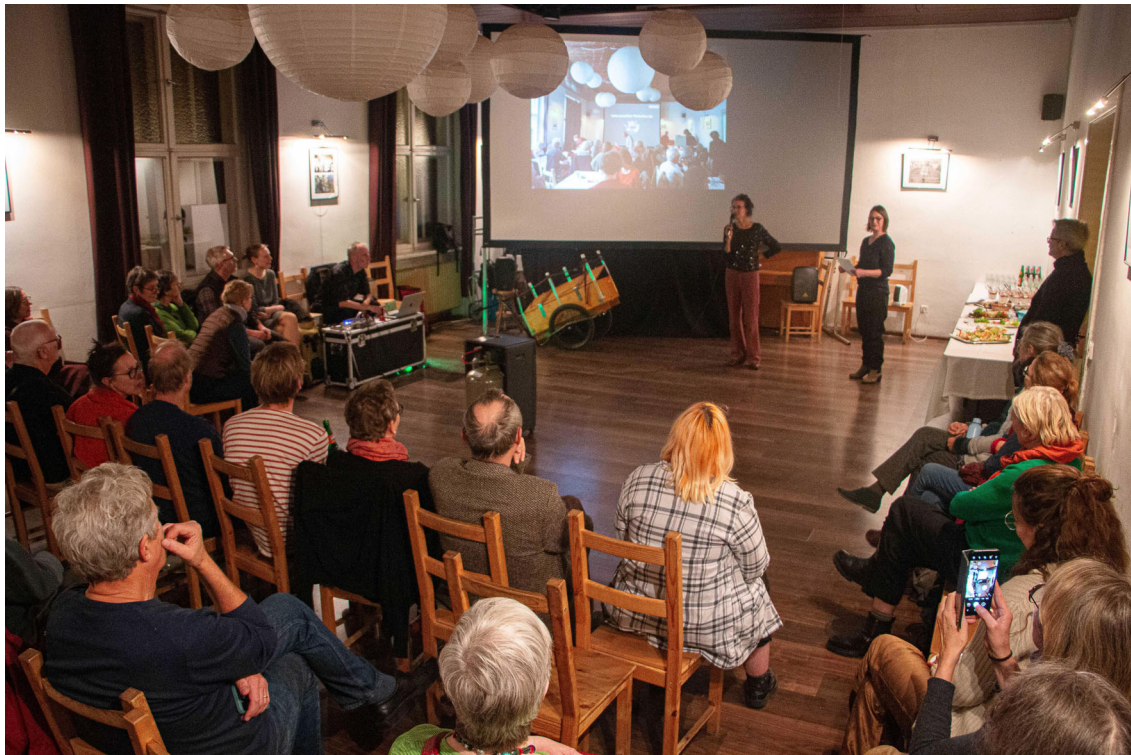
Dankesveranstaltung „Kino für Moabit“ am 27.11.2025

Und auch in Zukunft soll es weitergehen. Mit einer Petition machen die Ehrenamtlichen auf ihre Situation aufmerksam und bitten Politik und Verwaltung um finanzielle und räumliche Absicherung.