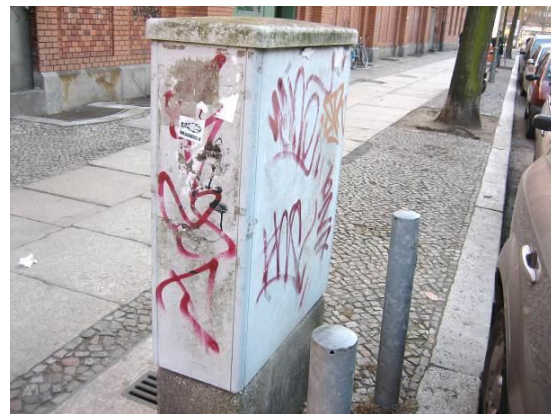
Verteilerkästen Turmstraße/Bremer Straße, Zustand Frühjahr 2012

Die meisten der etwa 80 Verteilerkästen im Umfeld der Turmstraße sind beschmiert bzw. „wild“ beklebt und beeinträchtigen den öffentlichen Straßenraum erheblich. Mit dem Projekt „Aktive Turmstraße“ soll der öffentliche Raum der Turmstraße durch die Gestaltung von acht bis zwölf Verteilerkästen an markanten Orten aufgewertet und durch die Durchführung von thematischen Veranstaltungen belebt werden.